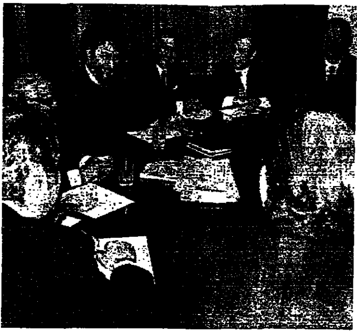
ساحة العام الصدر اجتماع اللجنة الوطنية للتحفة في مقر المجلس الاسلامي الشيعي امس

قال الرئيس شارل حلو « لتلاوة » قبل مغادرته لبنان أمس الى جنيف ، ان احد اسباب قيام الحكومة الحالية يكمن في صعوبة تكليف حكومة جديدة. ان لا تحول دون اعطاء حكم قوي ليبدأ بمطحي الى حد امكن من الامن وهدية السلطة. وكان الرئيس حلو قد غادر بيروت ظهر امس ، متوجها الى جنيف لترويض مؤتمر البرلمانيين الناخبين كليا او جزئيا باللغة الفرنسية ، وسيبقى الرئيس حلو اكثر من 20 يوما بين جنيف وباريس وروما. وما قاله الرئيس حلو : اننى اؤكد الصعوبات التي تعيقها هذه الحكومة ، والتي لم يكن في مقدورها ان تجتهد ، وان عددا من هذه المشكلات والمآسي سوف تعترض عمل اية حكومة ، الا ان ذلك لا يمنعني من ان اعرب عن اعتقادي بانه ان الارواح لافعال الراي العام دليلا على انه بإمكان ان تتكف حكومة من اشخاص يتمتعون بروصيد ضخم ، ويرتكون ذممة كآلوف وينتفون شعورهم بالمسؤولية ، بشكل يسهم في اعادة الطمأنينة الى النفوس والهشوه الى الشارع.